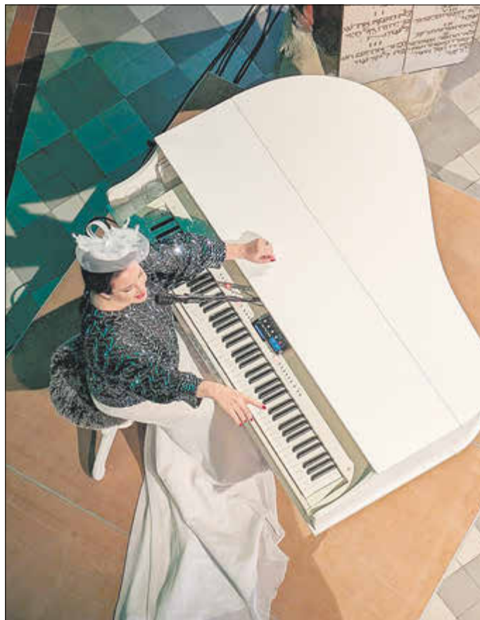
Die Sängerin Sefora Nelson im Konzert am 15.6.24 in Mupperg - wunderschön gesungen und sehr unterhaltsam moderiert!

Verwendungszweck: 5410- Kirchengemeinde Mupperg