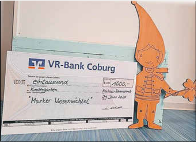
Die Wiesenwichtel und der Kulturverein arbeiten eng zusammen, so haben sich einige gemeinsame Feste im Veranstaltungskalender unserer Gemeinde etabliert. Für die großzügige Spende und die tolle gemeinsame Arbeit möchten sich alle großen und kleinen Wiesenwichtel bedanken. Wir freuen uns auf viele weitere gemeinsame Feste.