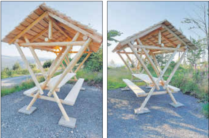
Die beiden Waldschenken am Lutherweg.