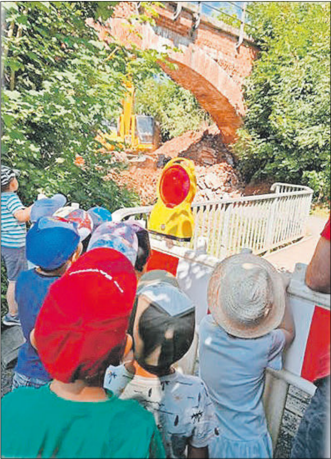
Am Kirmes Freitag überraschte uns der Kulturverein mit einer großzügigen Spende in Höhe von 1.000 €.