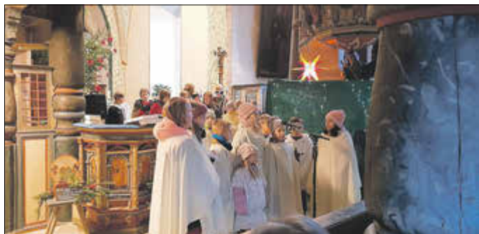
Krippenspiel Heiligabend 2022