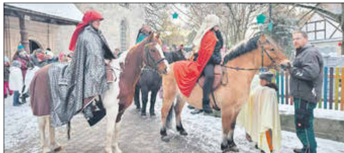
Stallweihnacht in der Mupperger Kirche und Reitstall Rädlein am 4. Advent 2022

Für Jugendliche gibt es den Insta-Account: jugendkirche_sola