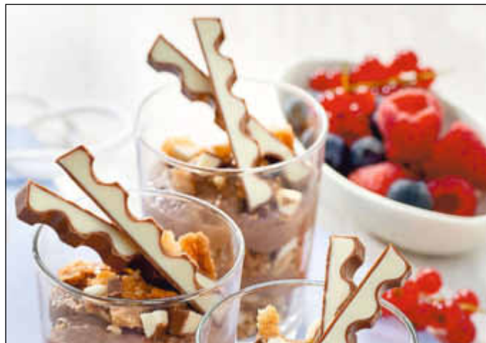
Leckerer Schoko-Schichtpudding mit kinder Schokolade

Butterkekse im Gefrierbeutel mit dem Nudelholz zerkleinern und mit der übrigen gehackten Schokolade mischen. Kalten Pudding cremig schlagen und abwechselnd mit der Keks-/kinder Schokolade Mischung in Dessertgläser schichten. Je nach Wahl mit halben kinder Schokolade-Riegeln, Früchten oder Sahne verzieren und gekühlt servieren. djd