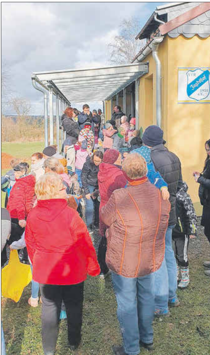
Ein herzliches Dankeschön geht an alle Helfer und Kuchenbäcker.